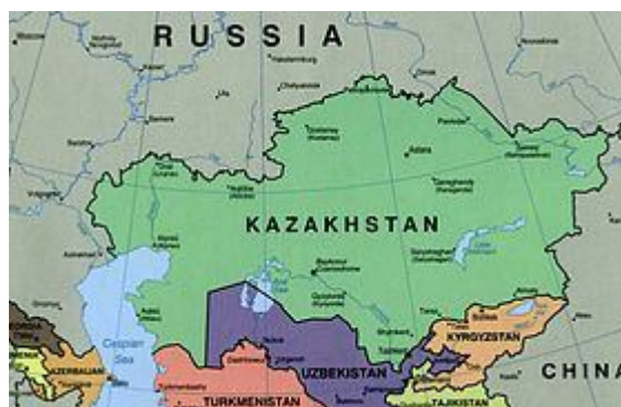
نقشه سیاسی قزاقستان و بخشی از آسیای میانه و قفقاز

با وجود وسعت زیادی که این کشور را نهمین کشور بزرگ دنیا قرار می‌دهد، بیشتر سرزمین آن کویر و استپ است و تراکم جمعیت آن تنها ۶ نفر در هر کیلومتر مربع است. میزان جمعیت که در سال ۱۹۸۹ به بیش از ۱۶ میلیون نفر رسیده بود، پس از استقلال قزاقستان و مهاجرت‌های زیاد به کشورهای دیگر به ۱۵ میلیون در سال ۲۰۰۶ تقلیل یافت.