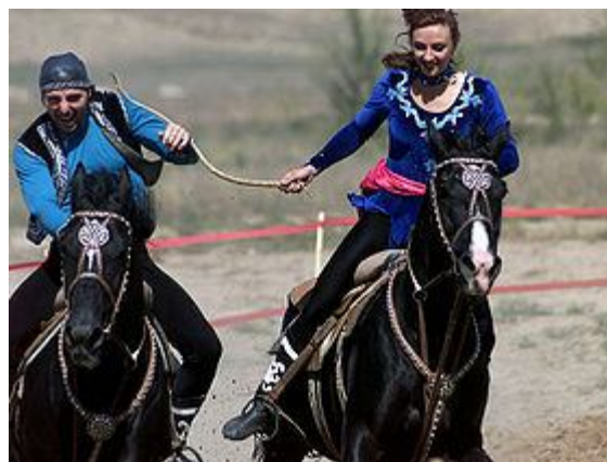
سوارکاران با لباس سنتی یک بازی بوسه به نام قیز کو را اجرا می‌کنند.